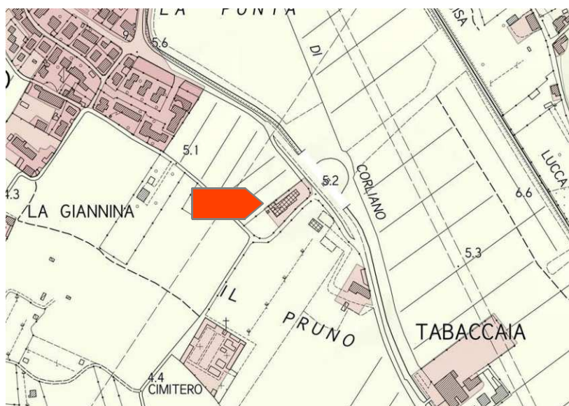
Estratto territorio urbanizzato scala 1:5000

La variante in oggetto non comporta impegno di suolo non edificato all'esterno del perimetro del territorio urbanizzato, non è soggetto alla Conferenza di copianificazione ai sensi dell'art. 25 comma 1 della LR 65/2014 e smii, l'intervento proposto è coerente con l'obiettivo già previsto dal POC vigente per le zone D prevedendo la riqualificazione di attività esistenti attraverso attuazione con piano di recupero e intervento di verifica sugli standard urbanistici. Altresì per la consistenza delle trasformazioni previste non rientra nelle restrizioni di cui all'art. 93 "termini del procedimento di formazione per il piano strutturale" della L.R. 65/2014 e smi.